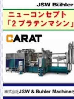
株式会社JSW & Buhler Machinery